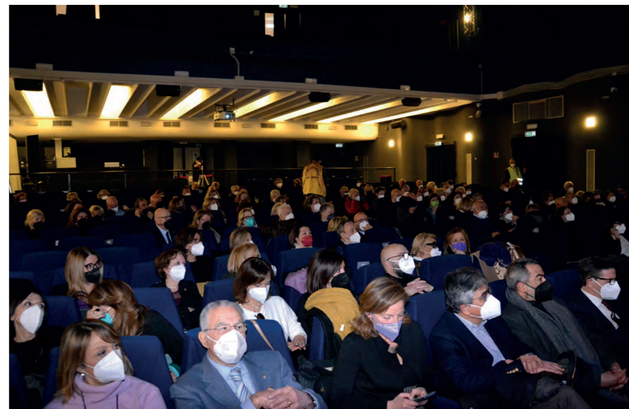
Il pubblico in sala