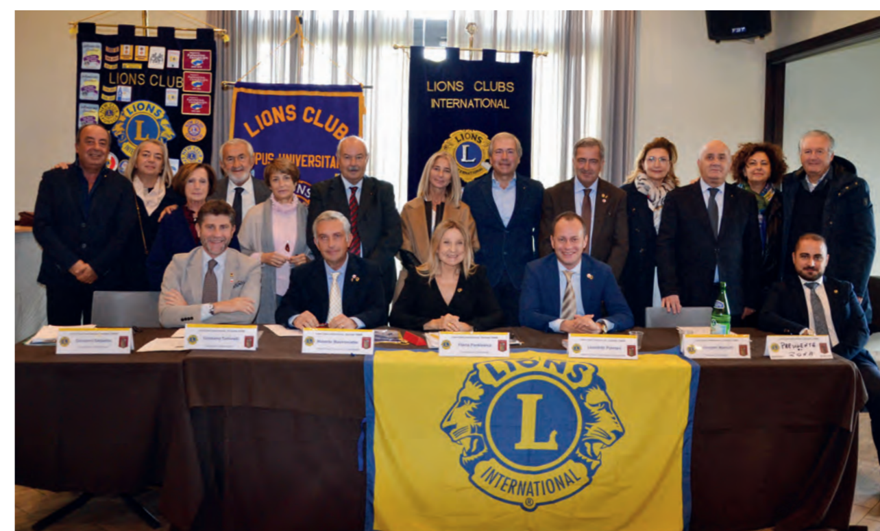
L'incontro con il Lions Club Altamura Jesce Murex

Tutte le immagini e i report degli incontri sono sul sito del Distretto 108AB e possono essere visualizzati cliccando sul link: https://www.lions108ab.it/visite-di-zona/