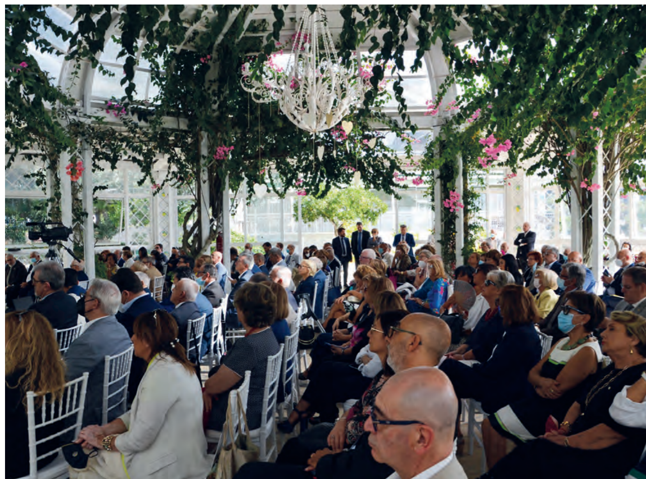
Sala gremita per il primo incontro plenario senza restrizioni numeriche

deportati nei campi di concentramento e dei soldati uccisi dai nazisti c'erano anche quelle dei soldati che hanno combattuto valorosamente ma si sono salvati e, tra queste, la foto del padre. E il pensiero l'ha fatta navigare nel tempo e nei sentimenti fino alla condanna degli orrori della guerra e dell'importanza vitale dei valori della pace (la tragedia della guerra in Ucraina era al di là da venire ndr ), della fratellanza, degli alti ideali. Gli stessi valori che hanno ispirato Melvin Jones a fondare, il 7 giugno del 1917 a Chicago, cioè 104 anni fa, il Lions Clubs International. "Ed io - ha concluso Flavia Pankiewicz - sono orgogliosa di farne parte".