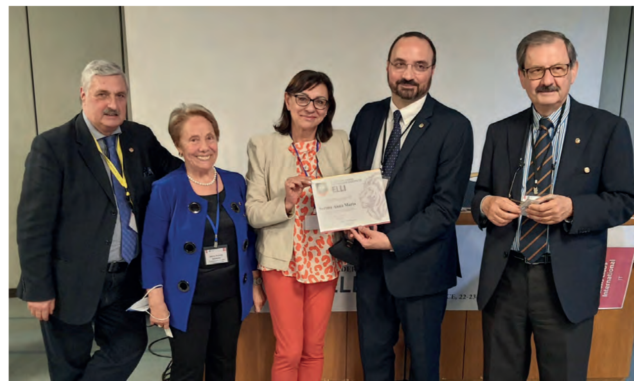
Alcuni momenti del Corso ELLI a Lecce