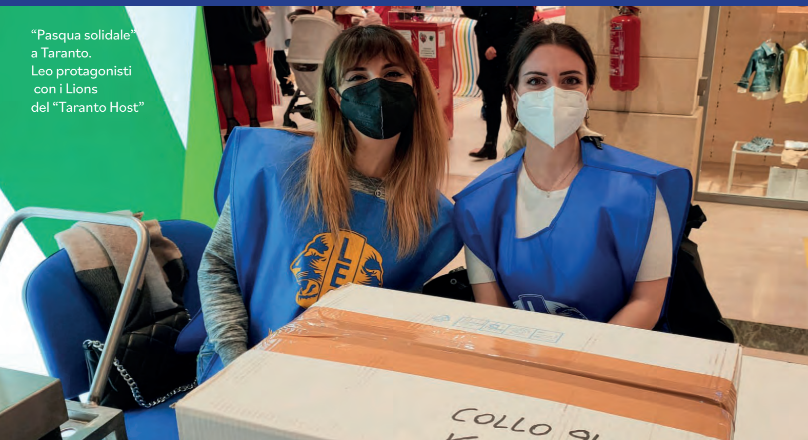
“Pasqua solidale” a Taranto. Leo protagonisti con i Lions del “Taranto Host”

E molto altro ancora... presto su Distretto 108AB La rivista dei Lions di Puglia