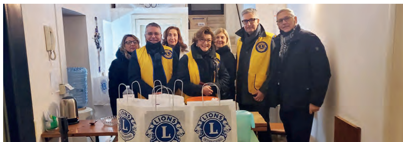
Lecce. Raccolta di derrate alimentari per "Aggiungi un posto a tavola"

Il nostro Distretto può anche vantare la quasi totalità di club che comunicano le attività di servizio, dimostrando senza alcun dubbio la propria vitalità, ponendo in risalto l'orgoglio locale e la volontà di leadership e fornendo i dati che permettono a LCI di individuare le pratiche migliori che possono essere condivise globalmente.