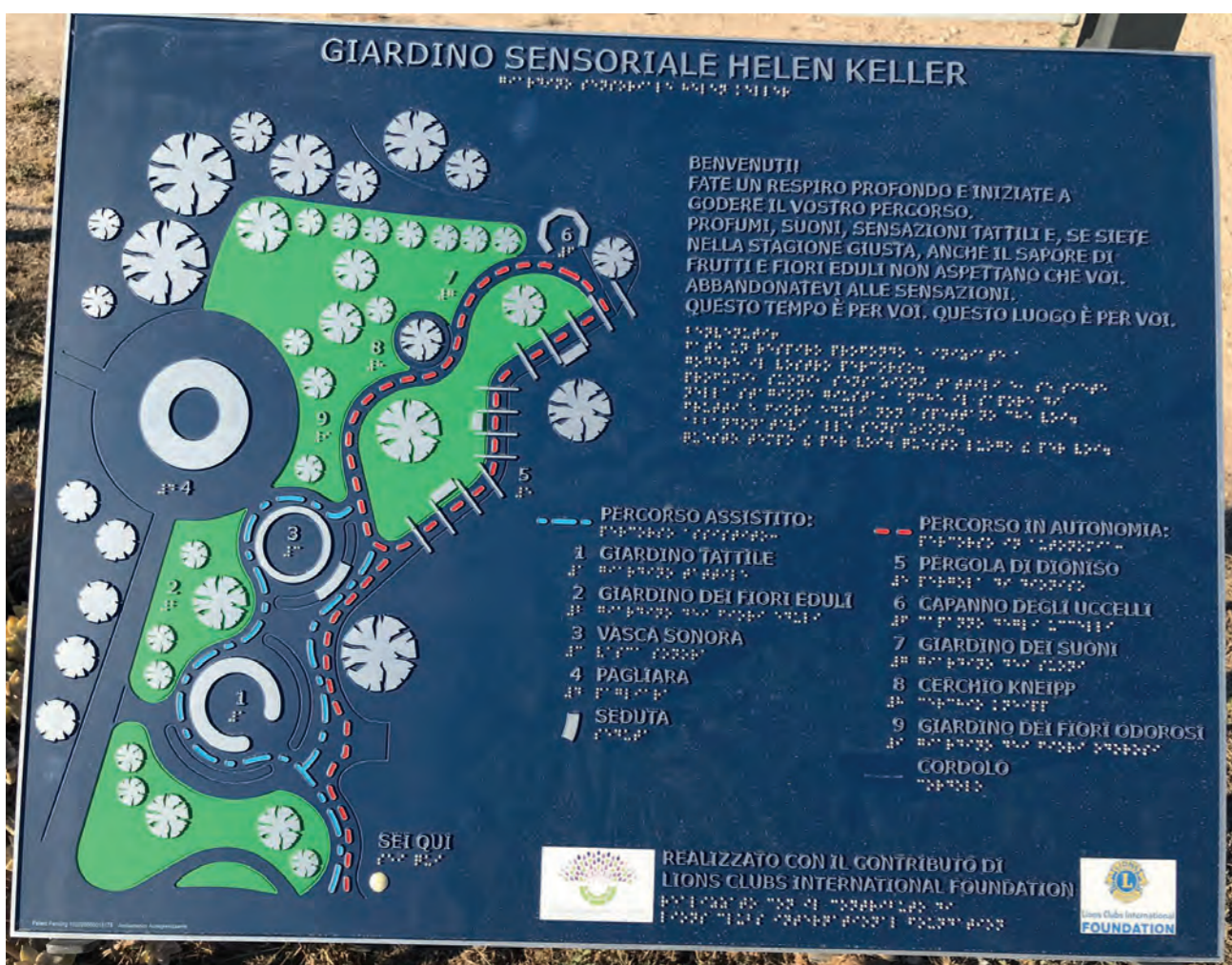
La tabella con la mappa del Giardino Sensoriale "Helen Keller" con l'indicazione dei due possibili percorsi appositamente progettati per i non vedenti: quello "assistito" e quello "in autonomia", in cui i cordoni che fiancheggiano il sentiero indicano il percorso da seguire. Tutte le descrizioni sono proposte anche in scrittura Braille

Il Giardino è intitolato a Helen Keller, la scrittrice statunitense simbolo dei Lions, autrice del celebre "Anna dei Miracoli", che ha ispirato film, sceneggiati e pièce teatrali. Insegnante e attivista per i diritti dei disabili, cieca e sorda dall'età di 18 mesi, Helen è la donna che nel 1925, con un suo memorabile discorso alla Convention del Lions Clubs International in Ohio, convinse i Lions a diventare "cavalieri dei non vedenti".