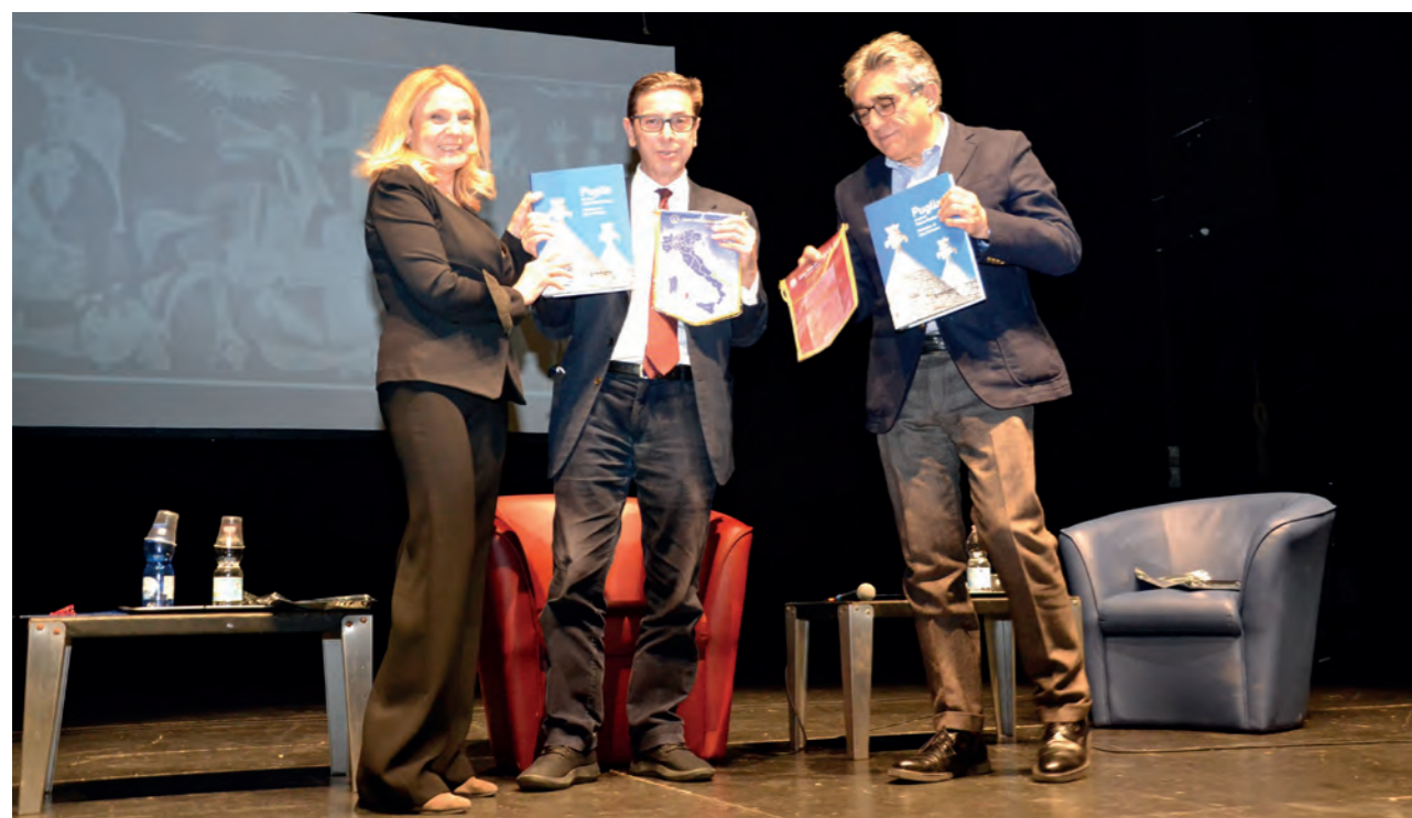
Consegna di guidoncino e dono ai relatori al termine della conferenza