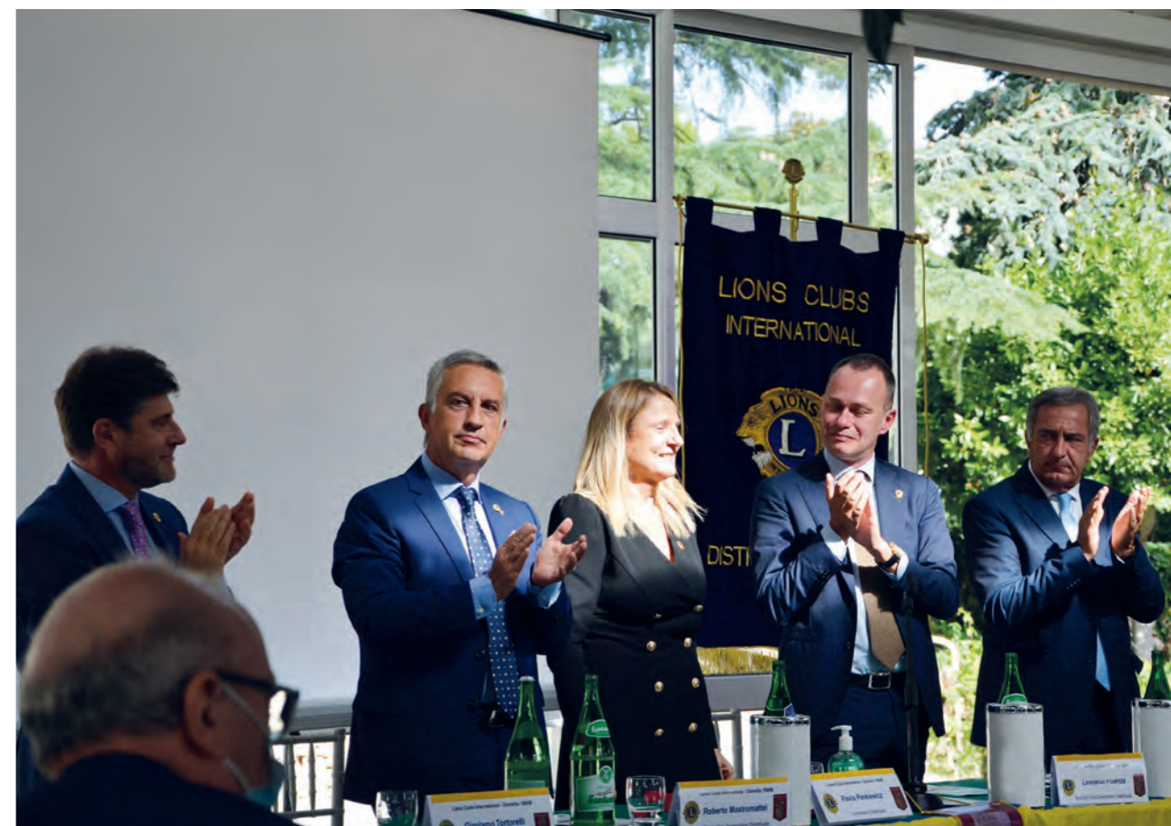
Applausi del tavolo di Presidenza, al termine dell'intervento

A proposito di service, nella sua puntuale programmazione, il Governatore ha indicato gli obiettivi ma anche l'organigramma, i nomi dei Lions-pilota che guideranno e si faranno carico di realizzare le iniziative programmate e da programmare, anche alla luce delle esigenze prioritarie del proprio territorio.