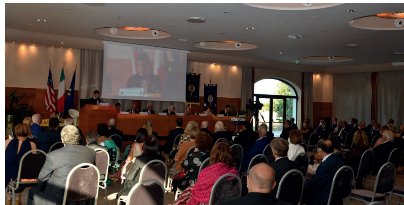
Acaya (Lecce). Il 16 luglio si è tenuta la cerimonia del Passaggio delle Consegne, primo incontro in presenza dopo il lungo lockdown ma ancora a numero chiuso a causa della vigente normativa anti Covid