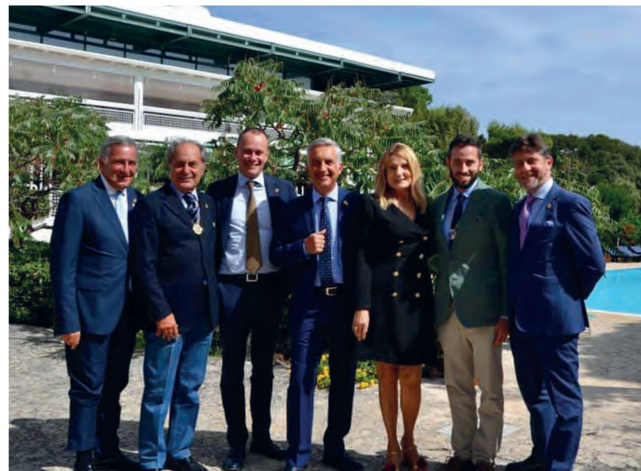
DG Team e alcuni componenti del Gabinetto Distrettuale