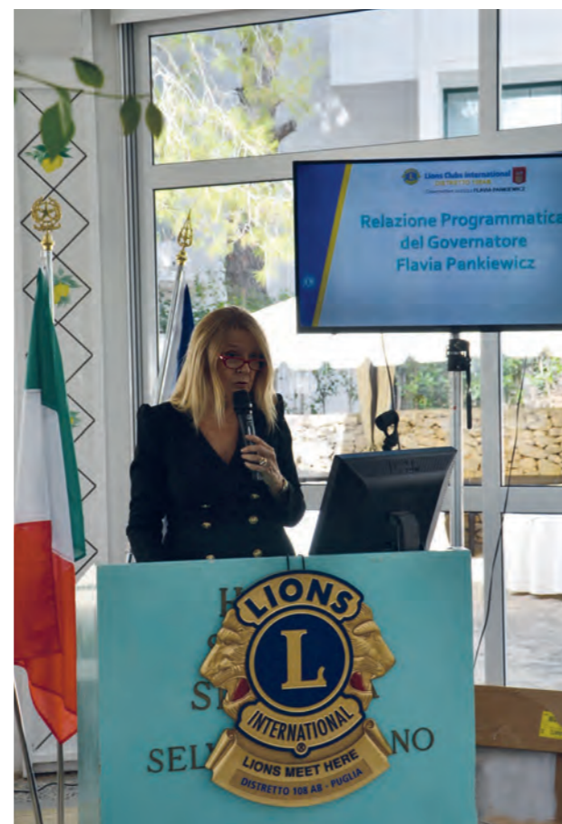
La Relazione Programmatica del Governatore

bene diamo il nostro contributo a rendere più umano questo pianeta, la casa di tutti che la cattiveria, l'ingordigia e l'indifferenza dell'uomo stanno rendendo sempre meno abitabile. Come ha dimostrato concretamente la pandemia, e come ha detto Papa