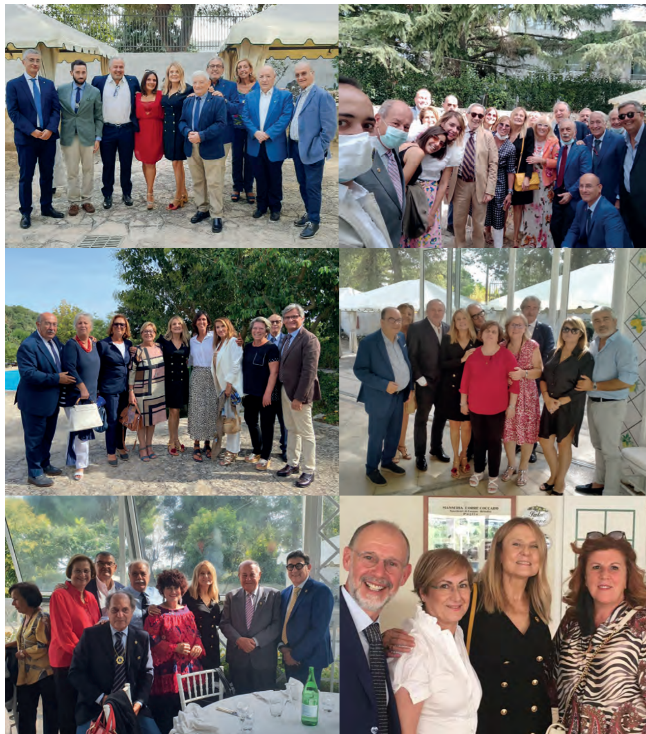
Selva di Fasano, Hotel Sierra Silvana. La Conferenza Programmatica è stata l'occasione per ritrovarsi insieme dopo il lungo lockdown