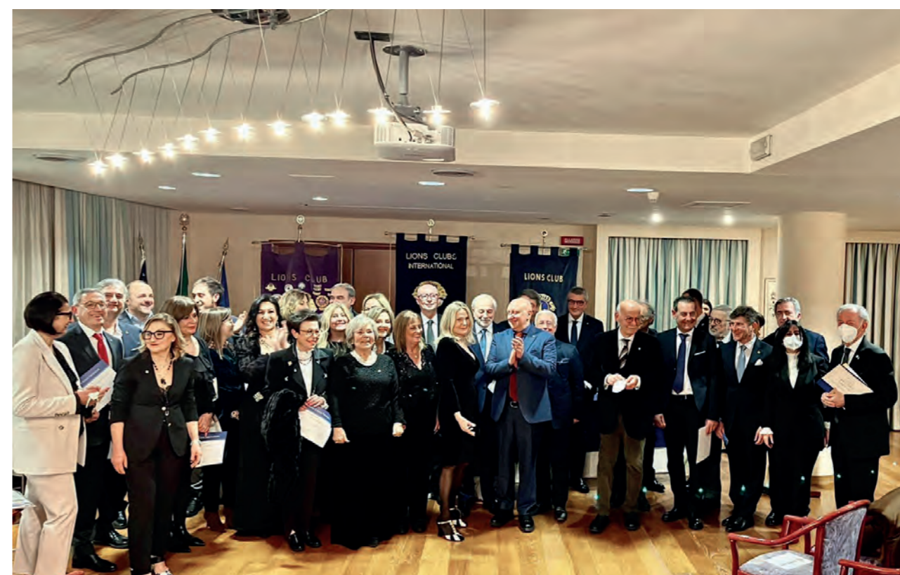
Prima Charter per Gioia del Colle Host Terra dei Peucezi (in alto) e Gioia del Colle - Putignano Monte Johe