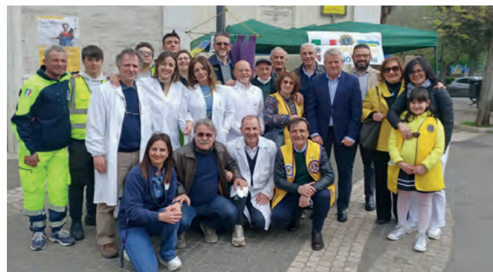
San Marco in Lamis