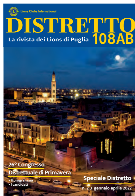
In copertina: Omaggio a Bari - Alba.

Gli articoli pubblicati rispecchiano il pensiero degli autori