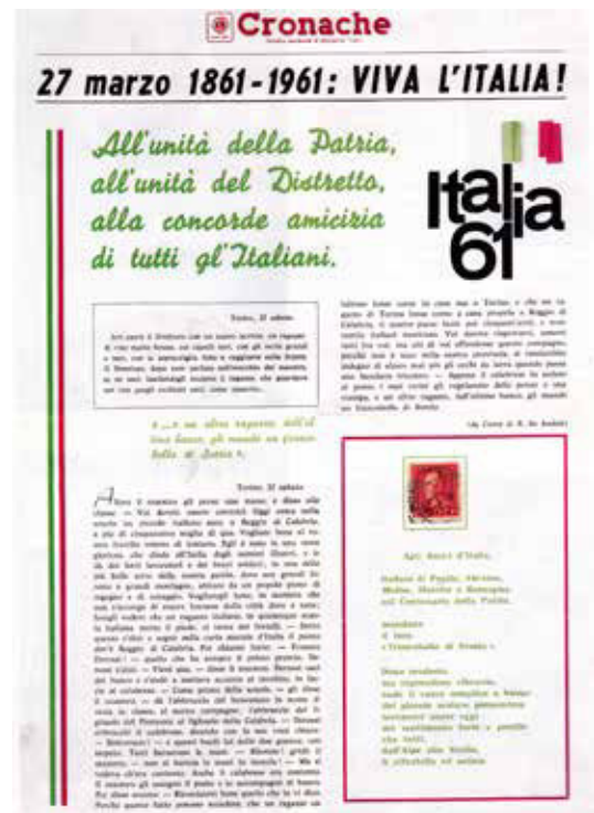
Rivista distrettuale "Cronache" di marzo 1961 edita da Schena Editore di Fasano