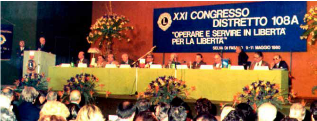
Selva di Fasano 9-11 maggio 1980. Il tavolo della Presidenza del 21° Congresso Distrettuale.