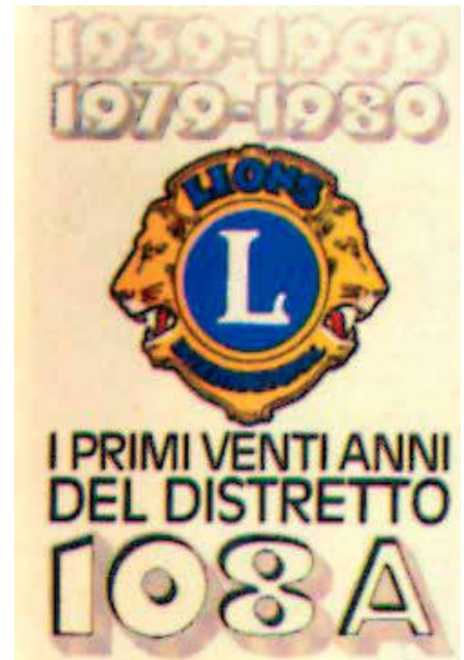
La pubblicazione edita in occasione del Ventesennale del Distretto.