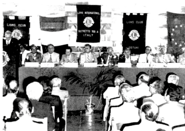
Rosa Marina di Ostuni 14-15 settembre 1979. Il tavolo della Presidenza all'11° Incontro d'Autunno.