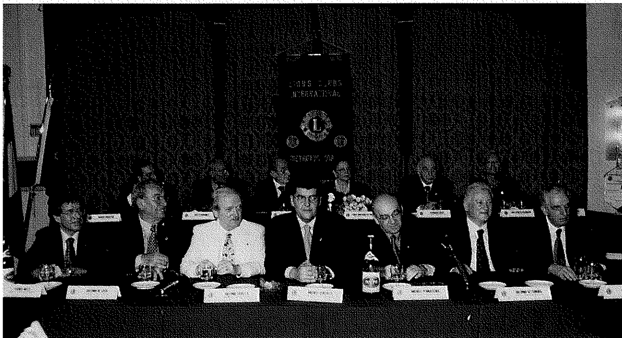
I componenti del Gabinetto Distrettuale 2001-2002 durante la cerimonia per lo scambio delle consegne.

chi succederà loro nella carica, il proposito di esprimersi al meglio nel nuovo ruolo.