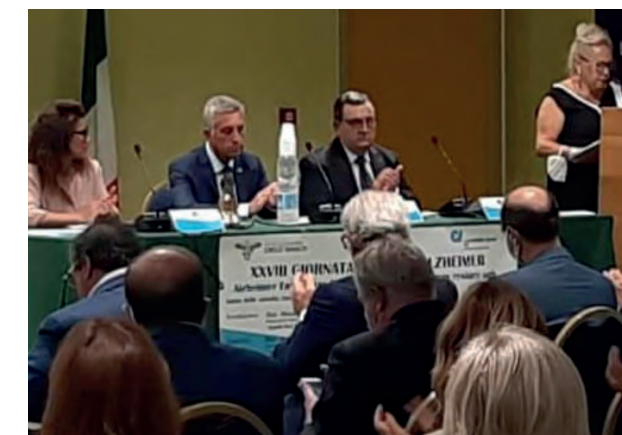
Un momento del convegno

A conclusione del convegno è intervenuto il Primo Vice Governatore, Roberto Mastromattei, che con delicatezza e maestria, ha affermato che la prima cosa di cui hanno bisogno le famiglie è una corretta informazione e un aiuto per affrontare al meglio le difficoltà del loro ruolo.