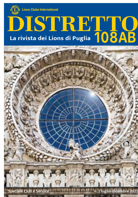
In copertina: Omaggio a Lecce Il rosone della Basilica di Santa Croce

Gli articoli pubblicati rispecchiano il pensiero degli autori