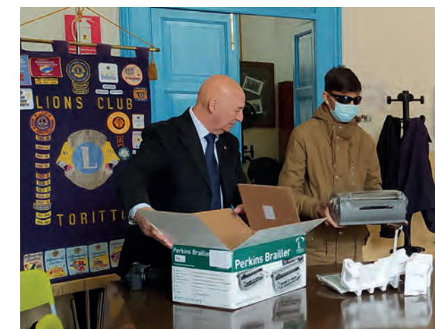
La consegna della dattilobraille al giovane studente