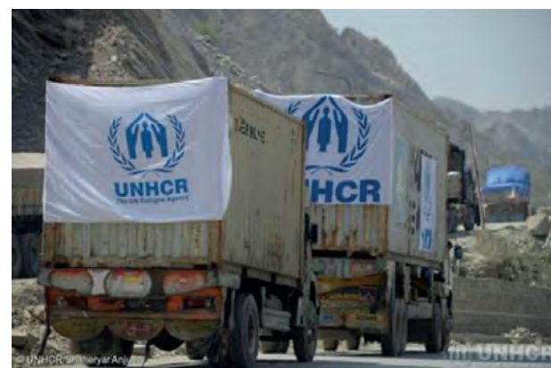
Camion UNHCR con aiuti umanitari in attesa di attraversare il valico di Torkham, al confine tra Pakistan e Afghanistan lo scorso 2 settembre

finalizzato a sostenere gli Enti Locali nella sensibilizzazione delle comunità ospitanti e l'integrazione sociale, scolastica e lavorativa delle persone che, a piccoli gruppi, dovessero arrivare nel nostro Distretto. Al momento risultano i primi arrivi in Provincia di Lecce. Sono sicuro che qui e ovunque arriveranno nel Distretto ci faremo trovare pronti ad accoglierli a braccia aperte, con il nostro sostegno e con il calore della nostra amicizia.